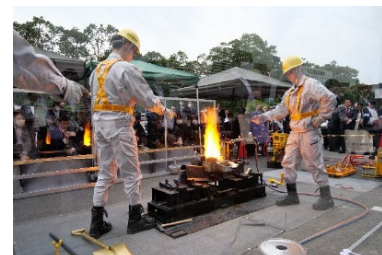
第9回鉄道技術展（2025年11月） 屋外での溶接デモの様子

今回は、前回開催（270社・団体（555小間）／会場4・5号館）から規模が大幅に拡大。出展者は336社・団体（746小間）、会場を3・4・5号館とし、さらには屋内では実施できない屋外でのレール補修実演デモ（テルミット溶接）なども実施します。